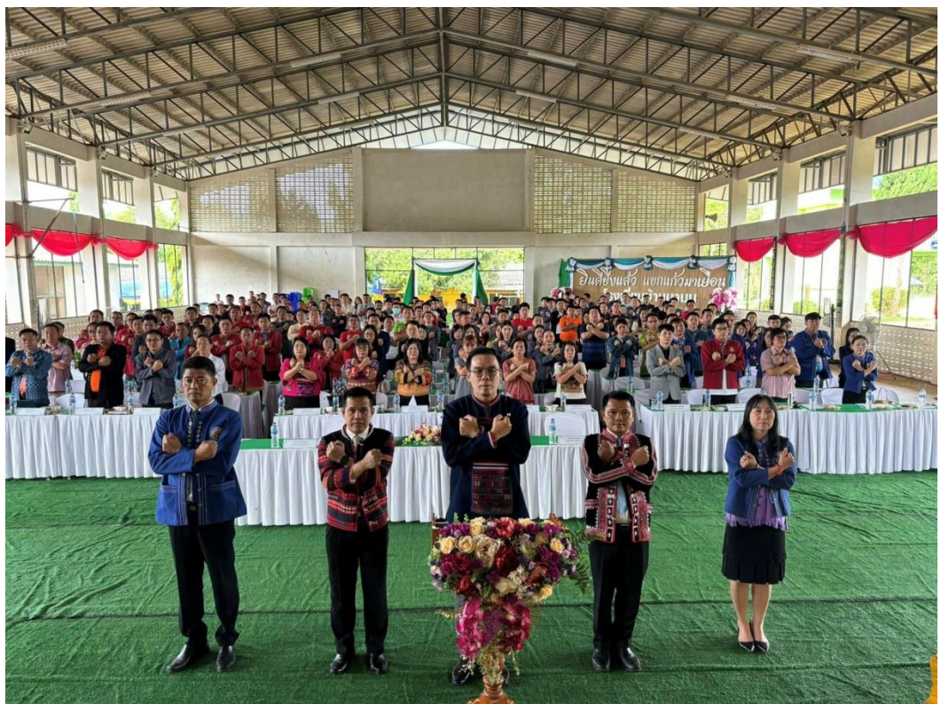
ภาพประกอบ การประชุมการประชุมผู้บริหารสถานศึกษาเพื่อปลูกจิตสำนึกและสร้างวัฒนธรรม ในการปฏิเสธการรับของขวัญและของกำนัลทุกชนิดจากการปฏิบัติหน้าที่ ณ ห้องประชุมคณินสิงขร โรงเรียนบ้านนามน อำเภอเวียงแหง จังหวัดเชียงใหม่