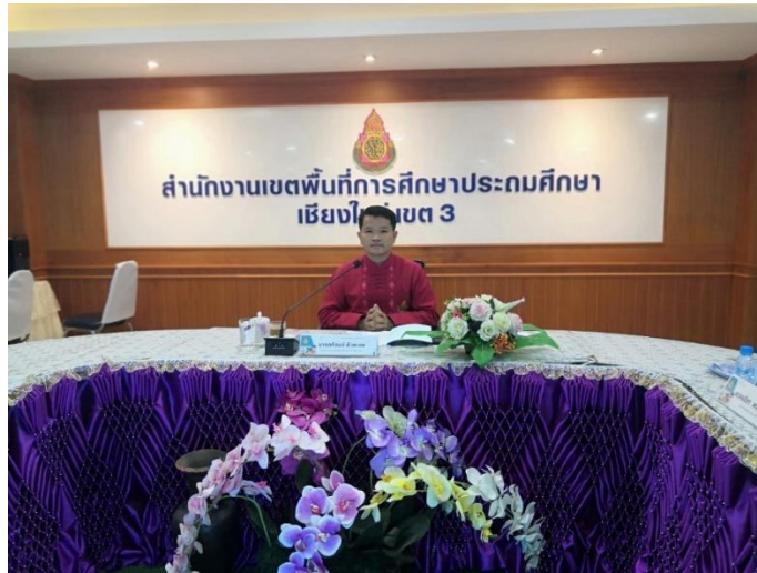
ภาพกิจกรรมการดำเนินการจัดประชุมคณะกรรมการรับนักเรียน ประจำปีงบประมาณ ๒๕๖๗