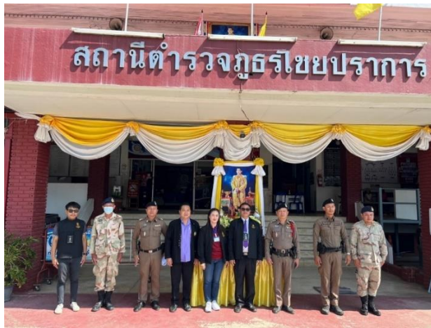
ภาพถ่ายการปฏิบัติหน้าที่ส่งเสริมความประพฤตินักเรียนและนักศึกษา ร่วมกับเครือข่าย